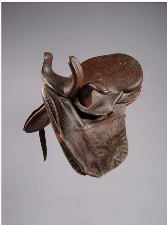
> Anonyme, selle d'amazone à trois cornes avec avance, premier quart du XIX e siècle, cuir, bois et métal, 70 x 65 x 50 cm, Château de Chantilly

Une forme équestre et acrobatique se structure et s'internationalise peu à peu, dans des espaces dédiés. Les spectacles mêlent voltige, équitation académique et références à la danse et au théâtre. Aux côtés de figures majeures comme François Baucher , Bastien Gillet- Franconi , Virgine Kenebel , ou encore de grandes familles telles que les Bouglione , Gruss , Houcke , l'exposition invite à découvrir comment les pratiques équestres issues des académies et de la tradition militaire ont évolué pour donner naissance au cirque moderne, tout en légitimant son existence face aux institutions théâtrales.