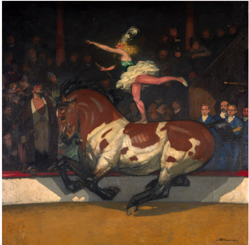
› Marcel Falter , Écuyère , vers 1930, huile sur panneau, 54 x 65 cm, collection J.-Y. et G. Borg., © Domaine public / Cnap Crédit photo : Yves Chenot

Cet univers permet de travailler l'expression des émotions ("c'est joyeux", "c'est impressionnant"), l'imaginaire ("on dirait une fête", "on dirait un défilé"), et le vocabulaire lié au spectacle. Les enfants peuvent facilement se projeter dans des activités ludiques : inventer un petit rôle, faire semblant d'être un cavalier, ou participer à une mini-parade en classe.