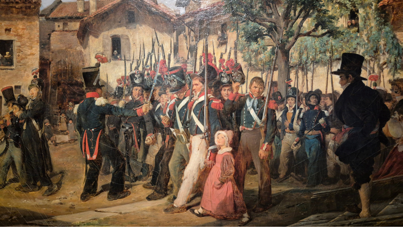
› François Auguste Biard , La garde nationale de campagne défilant devant le maire , vers 1836, huile sur toile, 70,5 x 96,6 cm, Paris, Musée de l'Armée

L'exposition se structure en trois parties , qui peuvent servir de fils conducteurs pour la visite et le travail en classe.