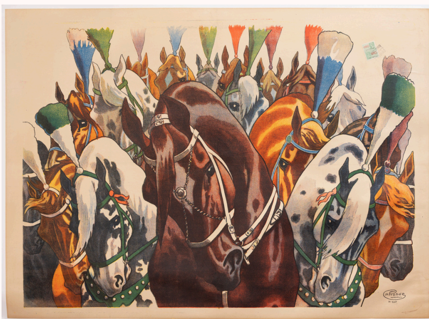
› William Rohde , Cavalerie de cirque , vers 1890, lithographie sur papier carton, 75,2 x 101,4 cm, musées de Châlons-en-Champagne, © Gauthier Himber

Les œuvres montrant des chevaux en mouvement (au pas, au galop, en position cabrée) permettent d'engager les enfants dans des activités d'imitation et de motricité. Le cheval devient une figure rassurante et identifiable, un repère visuel simple qui donne du sens à la visite du musée.