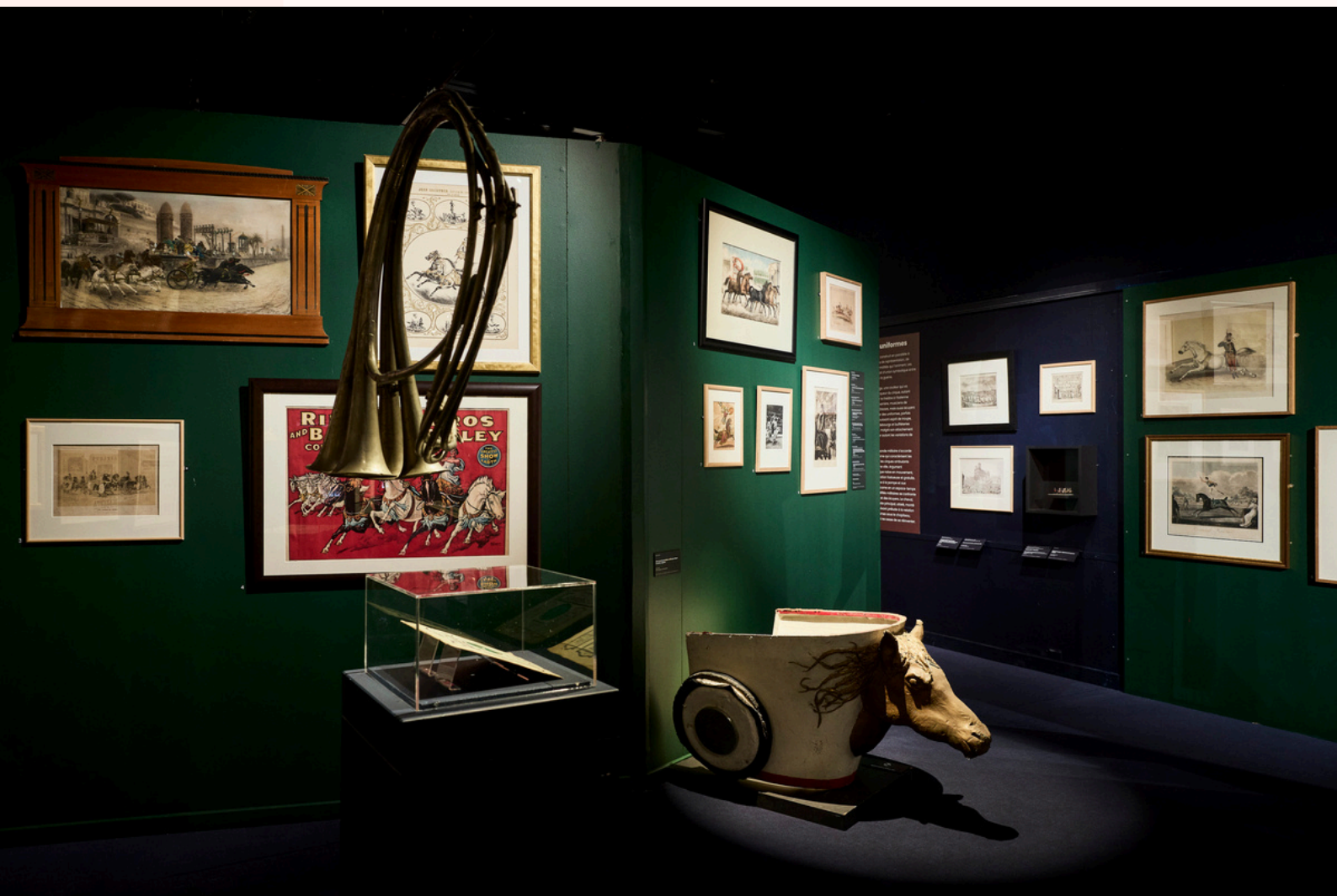
› Vue d'exposition, Panache ! , du 15 novembre 2025 au 16 mars 2026 au Musée des Beaux-Arts et d'Archéologie de Châlons-en-Champagne