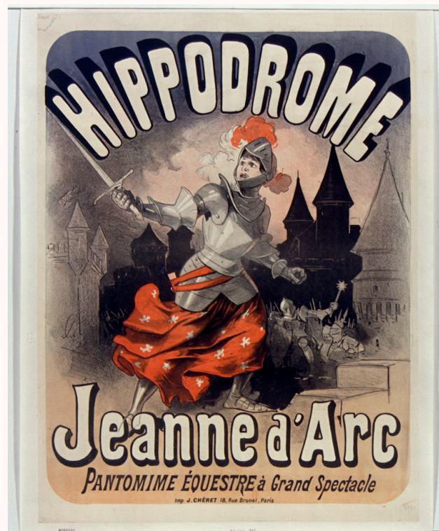
› Jules Chéret , Hippodrome, Jeanne d'Arc, pantomime équestre à grand spectacle , 1881, lithographie en couleurs, Bibliothèque Nationale de France, Estampes et photographie