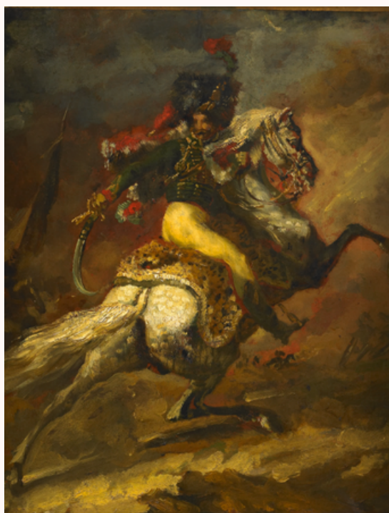
> Théodore Géricault , Etude pour le Portrait équestre de M. D*** (Salon de 1812), avant 1812, huile sur toile, 43 x 36 cm (sans cadre), Rouen, musée des Beaux-Arts, © C. Lancien, C. Loisel / Réunion des Musées Métropolitains Rouen Normandie

Les œuvres exposées montrent aussi des chevaux qui se cabrent, qui galopent ou qui s'arrêtent brusquement : autant d'attitudes qui permettent d'aborder l'importance du cheval et du lien entre monture et cavalier.