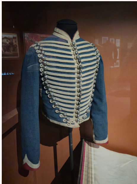
> Anonyme, Dolman de cavalier du 4ème régiment de hussards, Second Empire (1852-1870), drap de laine, toile de coton, cuir, laine et métal, 53 x 37,5 cm, Paris, Musée de l'Armée