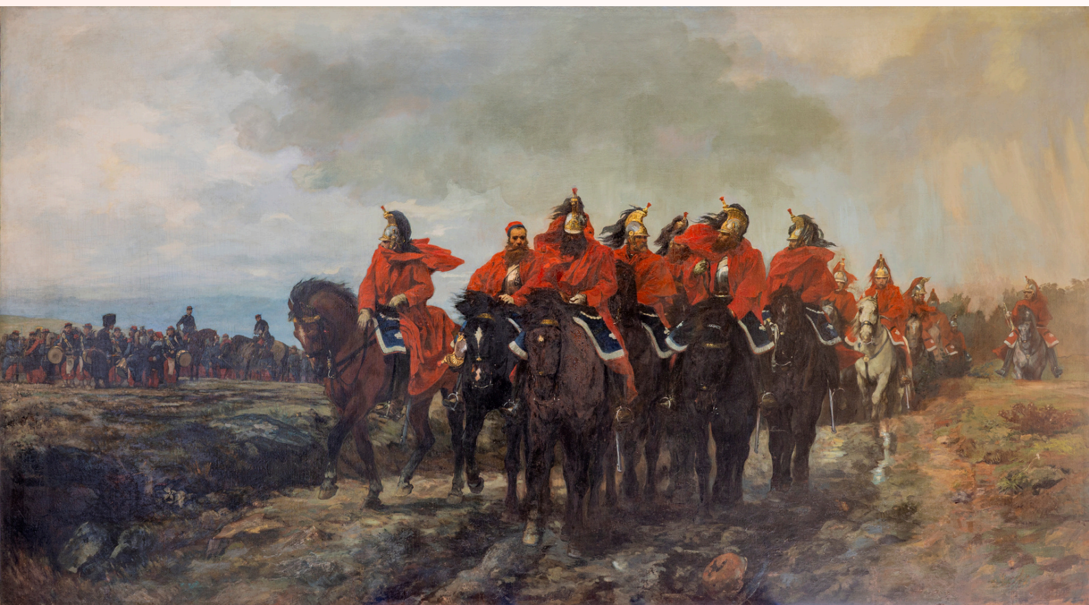
> Guillaume Régamey , Les sapeurs, tête de colonne du deuxième cuirassiers de la gare , 1868, huile sur toile, transfert de propriété à la ville de Châlons-en-Champagne

Les élèves apprennent que les images peuvent raconter des événements. Ils peuvent décrire ce qu'ils voient, imaginer ce qui se passe avant ou après, et comprendre que ce que l'on montre sur scène ou dans une image est souvent le résultat d'un choix : un geste, un costume, une position du corps.